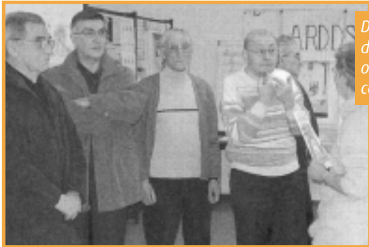
Des personnes connaissant des problèmes d'audition sont venues parfois de loin pour obtenir des renseignements dans le cadre de cette journée nationale de l'audition.