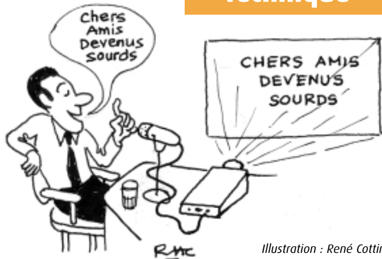
Illustration : René Cottin

gramme est une représentation en trois dimensions donnant la fréquence et l'intensité en fonction du temps). La première tâche de l'ordinateur consiste alors à détecter et à séparer les phonèmes. Ensuite, il crée des hypothèses de mots par comparaison avec un dictionnaire contenu dans le disque dur. Puis il procède à une analyse sémantique et syntaxique, c'est-à-dire qu'il tente de retrouver une succession de mots cohérents. Car les difficultés sont multiples. Bien que notre alphabet possède 26 lettres, la langue française comporte 37 phonèmes. Les mots sont souvent enchaînés de façon continue, avec des liaisons, sans coupure apparente. Certaines lettres sont muettes. La voix est variable, grave ou aiguë, parfois chuchotée, enrôlée ou tremblante... Il faut compter aussi avec les accents régionaux (un quai est prononcé "qué" ou "què"