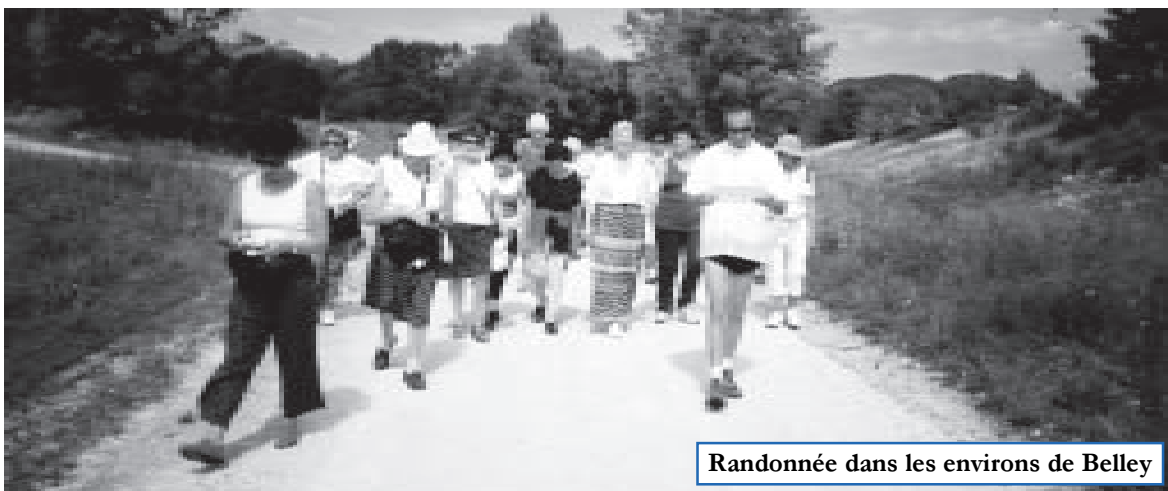
Randonnée dans les environs de Belley