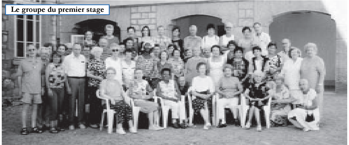
Le groupe du premier stage

B elley... Connaissez-vous, avant ce premier stage, cette petite ville, sous-préfecture de l'Ain, ancien évêché, entre Jura et Alpes ?