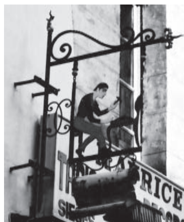
Vieille enseigne, faubourg Saint-Antoine

Contacteur : Nicole Hameau 7, rue des Rigoles 75020 Paris Tél./Fax : 01 44 62 63 24