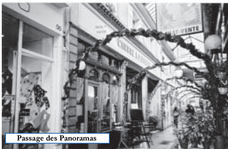
Passage des Panoramas