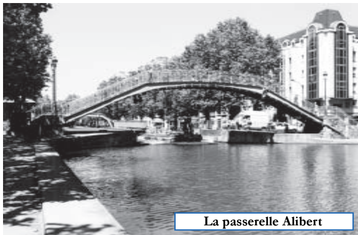
La passerelle Alibert

Des réalisations plus récentes de l'aménagement de la ville, comme le nouveau quartier de Bercy ou le parc André-Citroën, font également partie de la liste. Tandis que ni les musées (musée